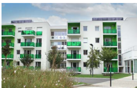
La Cité des Aînés , Saint-Etienne