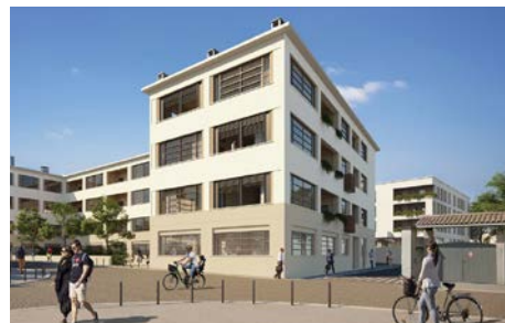
Gégé , Montbrison