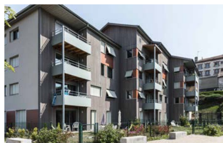
La Galachère , Saint-Héand