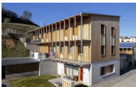
Puits de la Motte , Meys