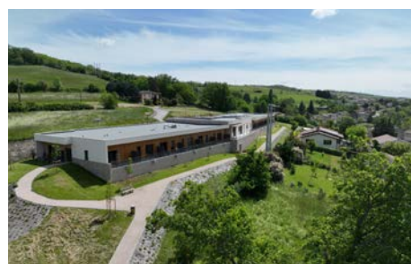
MARPA , Ternand