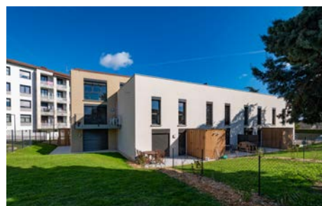
Les Fifres d'Or , Mornant