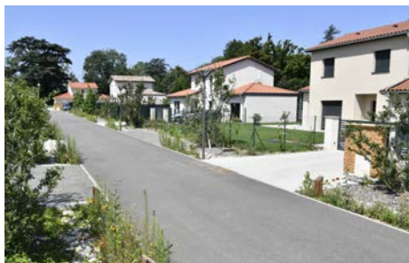
ZAC des Charmilles , Gleizé