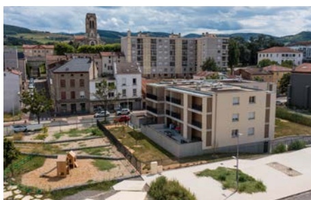
L'îlot Pasteur , L'Horme