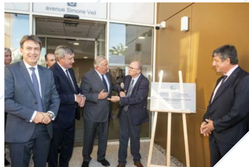
Inauguration du siège social de la SAC en présence de Gérard Larcher, Président du Sénat